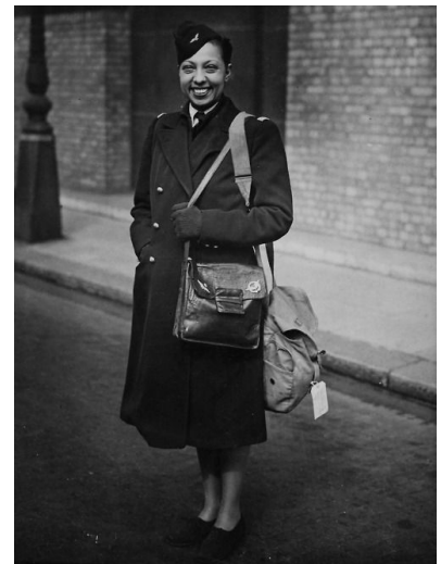
Joséphine Baker en 1945 lorsqu'elle reçoit la croix de guerre, la rosette de la Résistance et qu'elle est faite chevalière de la légion d'honneur

Une minute de silence puis une Marseillaise entamée par le chœur de l'armée française ont suivi la prise de parole du président de la République.